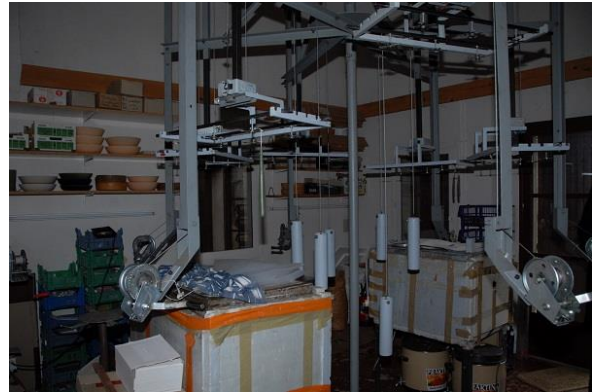
Ciergerie de la Maison Magdalena